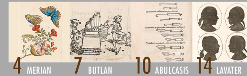
4 MERIAN 7 BUTLAN 10 ABULCASIS 14 LAVATER